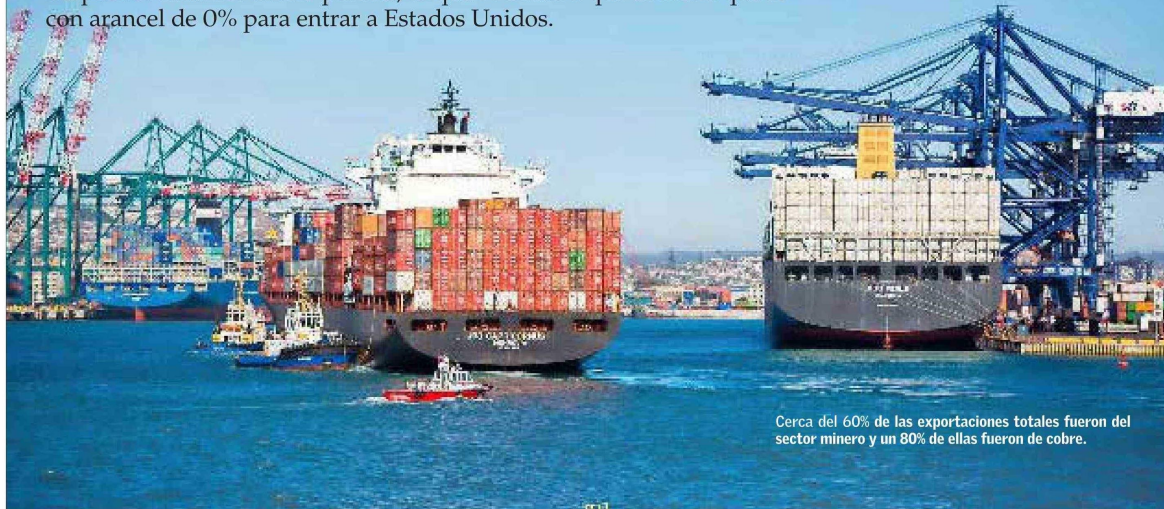
Cerca del 60% de las exportaciones totales fueron del sector minero y un 80% de ellas fueron de cobre.

Los máximos observados en la cotización del cobre aumentaron los despachos mineros el año pasado, lo que se suma a que el metal quedó con arancel de 0% para entrar a Estados Unidos.