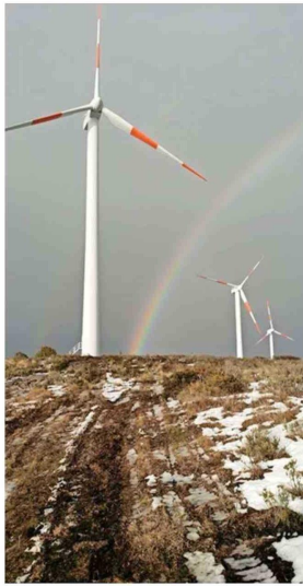
Durante los ocho años que lleva SCX certificando bajo el estándar de I-REC, la compañía construyó un mercado de atributos energéticos desde cero. Desde cómo se audita, cómo se genera confianza en actores que al principio se miran con escepticismo, y cómo se articula la cadena entre quien produce, quien certifica y quien declara".

"Certificar no es un fin en sí mismo, sino la infraestructura de confianza que hace posible la descarbonización real".