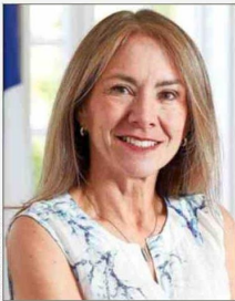
Susana Jiménez , presidenta de CPC.

Para la presidenta de la Confederación de la Producción y del Comercio (CPC), Susana Jiménez, el deterioro de los indicadores económicos es un factor de preocupación, y por eso espera "anuncios que permitan generar mejores condiciones para crecer, invertir y crear empleo. La última cifra de desempleo, que alcanzó 9,1%, hace imperativo avanzar en medidas que reactiven la inversión y permitan recuperar dinamismo económico. Hoy la principal urgencia es volver a generar oportunidades laborales para las cerca de 950 mil personas que buscan trabajo y también para los 2,5 millones de trabajadores que se desempeñan en la informalidad". En este sentido, sostiene que lo más relevante será "avanzar en medidas que impulsen la competitividad del país. Una reducción del impuesto corporativo hacia niveles más alineados con los estándares internacionales y una agenda decidida para agilizar los permisos sectoriales y ambientales pueden ayudar a destrabar proyectos, atraer inversión y generar más empleo".