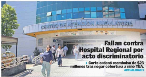
Fallan contra Hospital Regional por acto discriminatorio Corte ordenó reembolso de $23 millones tras negar cobertura a niño TEA. ACTUALIDAD 3