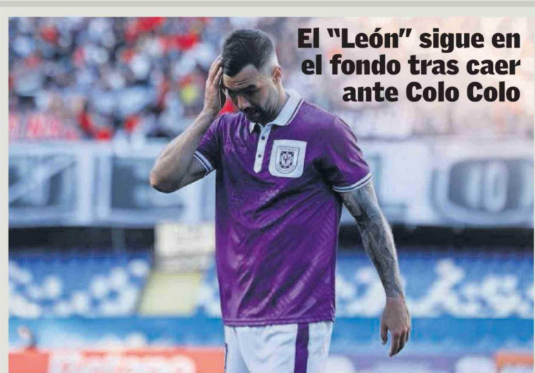
El "León" sigue en el fondo tras caer ante Colo Colo

Deportes Concepción perdió por la mínima ante los albos en el Ester Roa Rebolledo. Con este resultado los lilas solo suman cuatro de los 28 puntos en disputa en su regreso a Primera División.