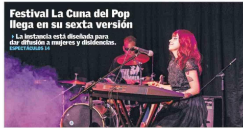
Festival La Cuna del Pop llega en su sexta versión La instancia está diseñada para dar difusión a mujeres y disidencias. ESPECTÁCULOS 14