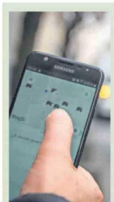
6 MODIFICACIÓN Ley Uber genera debate entre Muñoz y De Grange

Lunes 6 de abril de 2026 / Año 144 - Edición 49812 / $700