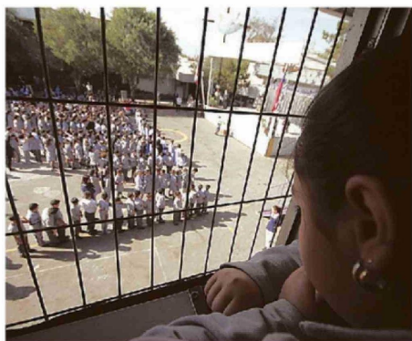
DISCRIMINACIÓN REGISTRÓ 392 DENUNCIAS EN LA REGIÓN.

En el ámbito local, es preciso indicar que tal co-