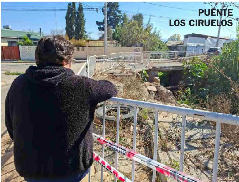
PUENTE LOS CIRUELOS

El proyecto de extensión de redes de agua potable y alcantarillado permitirá entregar una solución sanita-