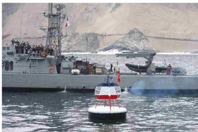
► Este es el último 21 de mayo que preside Gabriel Boric.