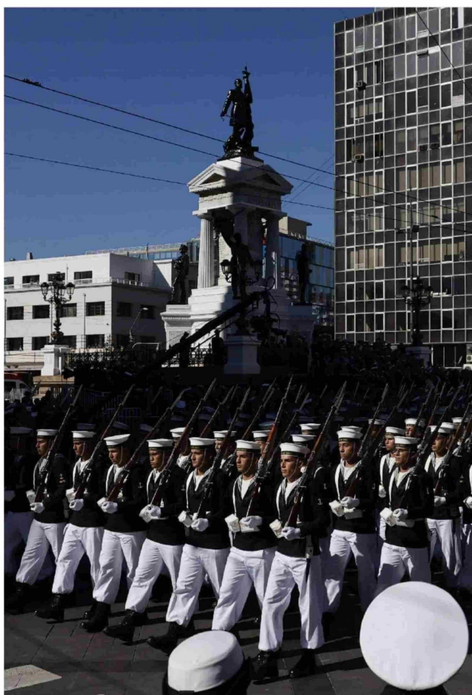
► La Plaza Sotomayor fue el epicentro de las actividades de este 21 de mayo.

Antes de la llegada del Mandatario, el almirante de la Maza -quien finaliza su periodo al mando de la Armada el 18 de junio- concedió una breve entrevista a TVN: "Lo más importante es que uno recibe una posta, hay cosas que venían de antes y a algunos les toca cortar cintas. Hay otros que no. Probablemente hay cosas que quedaron en el tintero y que las va a tomar el que venga (...) y seguir con esta planificación institucional que ha tenido un buen eco en la ciudadanía y en el gobierno sobre todo", destacó. Más tarde, en su discurso el comandante en jefe de la institución naval relevó las gestas que se conmemoran esta jornada, la modernización de la institución, su proyección oceánica y antártica, y enfatizó en impulsar la cultura oceánica en la ciudadanía. ●