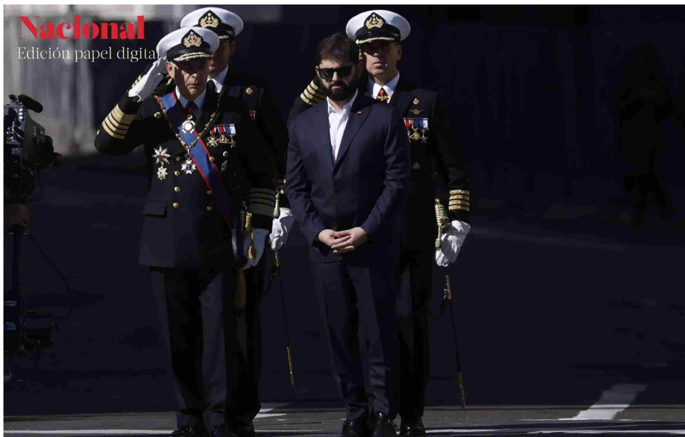
► El Presidente Gabriel Boric junto a las autoridades de la Armada.

Tiraje: 78.224 Lectoría: 253.149 Favorabilidad: No Definida