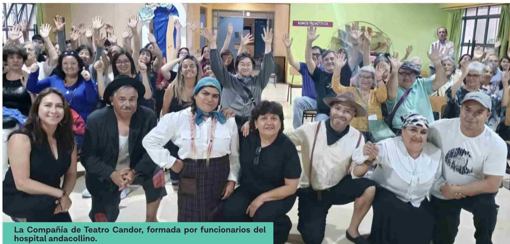
La Compañía de Teatro Candor, formada por funcionarios del hospital andacollino.