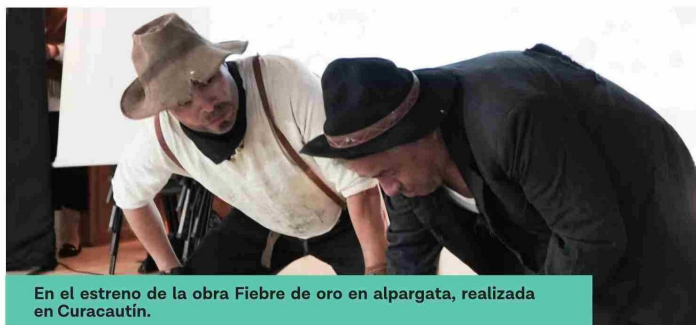
En el estreno de la obra Fiebre de oro en alpargata, realizada en Curacautín.

entonces existimos como Compañía de Teatro Candor", explica. Reconoce que no fue un camino sencillo, pues no tenía formación teatral. "Lo más cercano al arte fue tocar trompeta en la Banda Instrumental de Andacollo. En quinto básico escribí una obra y gané un concurso, pero nunca pensé que eso marcaría un camino artístico".