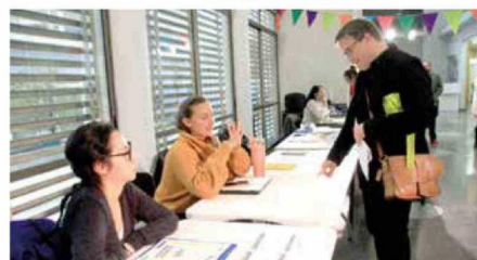
En el marco de esta feria, hubo exponentes de distintas áreas, literatura, artes visuales, pintura, entre otras.