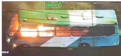
Serios incidentes se produjeron anoche en diversas comunas de la capital. Desconocidos atacaron una comisaría y quemaron un bus del transporte público en Cerro Navia (en la imagen).