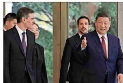
El líder chino, Xi Jinping, se reunió con el jefe del Gobierno español, Pedro Sánchez, como parte de su aproximación a Europa.

TEMAS ECONÓMICOS: "EE.UU., ¿DAÑO PERMANENTE?" | A 3 ANÁLISIS DE RECONOCIDOS INTELLECTUALES EXTRANJEROS AL ACTUAL MOMENTO Y LOS DESAFÍOS DE LA GLOBALIZACIÓN | B 6, B 7, B 8, B 9, B 10 y B 11