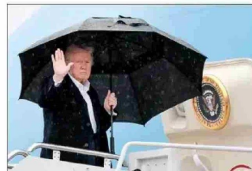
El mandatario estadounidense, Donald Trump, "es optimista" de alcanzar un acuerdo con Beijing, informó la Casa Blanca.

“La caída del precio (del cobre) podría afectar nuestra operación en Estados Unidos”.