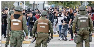
Durante la tarde, barras bravas del equipo albo provocaron desmanes en el Monumental. Lanzaron piedras a carabineros y cortaron el tránsito en las calles aledañas.

Exautoridades y especialistas advierten múltiples fallas en los anillos de control al exterior del recinto de Colo Colo, como la falta de especialización de guardias en el interior.