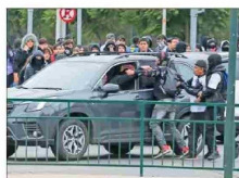
Automovilistas también sufrieron agresiones de barras en los alrededores del campo deportivo.

La Moneda decide suspender el Superclásico del domingo: "Es un triunfo para los violentos que no quieren que se desarrolle el fútbol", se lamentan en la U, de Chile.