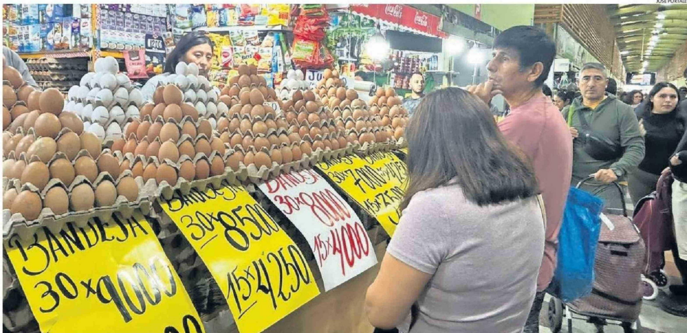
A PESAR DEL ALZA, LOS HUEVOS SIGUEN SIENDO UN PRODUCTOS INDISPENSABLE EN LA DIETA DE LOS IQUIQUEÑOS.