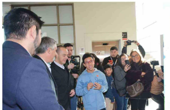
Niños, niñas y adolescentes de Teletón O'Higgins exhiben sus obras artísticas en una muestra abierta a toda la comunidad.

Cada obra expuesta refleja recuerdos, emociones y experiencias personales de sus creadores.