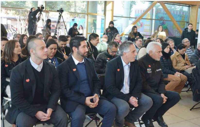
Autoridades regionales participaron de la inauguración de la exposición "El Trebolar Recién Regado" en el Teatro Regional Lucho Gatica de Rancagua.