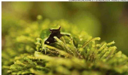
COMUNICACIONES FUNDACIÓN HUILO HUILO.