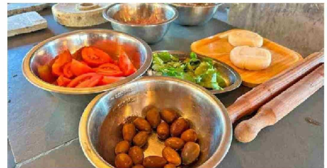
Los ingredientes utilizados en la instancia de alta cocina siguen la lógica "cerro kilómetros", siendo producidos por emprendedores locales o provenientes del huerto propio.

Para Cáceres, "los productores campesinos son protagonistas de los platos que preparamos los chefs y es nuestra responsabilidad darles visibilidad", por lo que ha visitado distintas comunas de la región en búsqueda de ingredientes producidos localmente para sumar al restaurante, mencionando como ejemplo el reciente nexa con Flor de Oro, azafrán que se produce en Graneros.