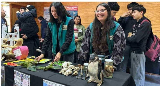
PUÑIHUIL ES UN PUNTO ESTRATÉGICO Y VALIOSO PARA LA CONSERVACIÓN DE LOS PINGÜINOS.