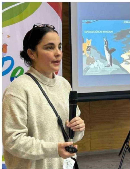
LA JORNADA INCLUYÓ UNA SERIE DE CHARLAS QUE DIERON CUENTA DEL VALOR DE ESTAS AVES NO VOLADORAS.

Uno de los focos principales fue relevar la importancia del territorio chilote como hábitat para el pingüino de Humboldt y el