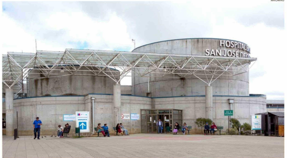
EL HOSPITAL BASE ES EL RECINTO CON EL MAYOR NÚMERO DE TRABAJADORES ASOCIADOS AL SERVICIO DE SALUD OSORNO.

SALUD. Se trata de los cinco recintos asistenciales, incluido el Hospital Base de Osorno, donde durante 2024 se registraron 126 mil días promedio de ausentismo legal por enfermedad, mientras que en 2025 la cifra bajó a 104 mil, es decir, 22 mil días menos. Para 2026 se proyecta alcanzar los 77 mil días promedio, según datos del Servicio de Salud de Osorno.