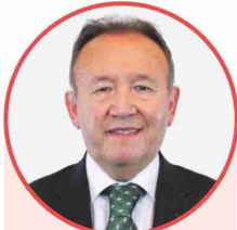
José García Ruminot

SEGPRES: Militante RN. Contador público y auditor. Actualmente, es senador por la 15.ª Circunscripción Sur, Región de La Araucanía. Ejerció como presidente del Senado, entre el 19 de marzo de 2024 y el 26 de marzo de 2025.