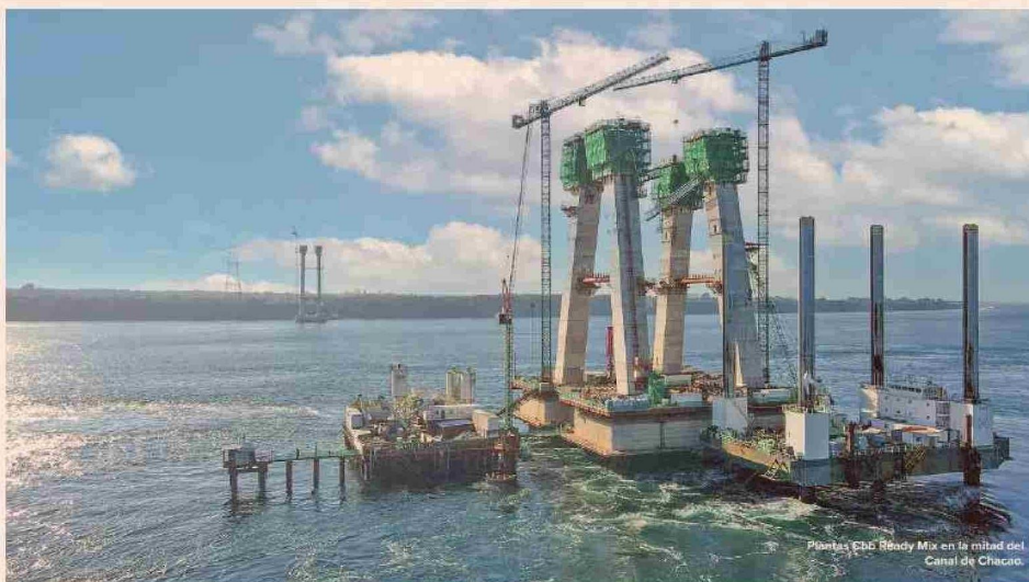
Plantas Cbb Ready Mix en la mitad del Canal de Chacao.

"Para nosotros, este proyecto representa un gran desafío debido no solo a las exigencias técnicas del hormigón, sino también a la logística y la operación de las plantas. En particular, las dos plantas ubicadas en la mitad del mar (roca remolino) han requerido un diseño cuidadoso en un espacio de apenas 1100 m2, que es 10 veces menor que lo necesario para una planta estándar, donde se ha planificado la distribución completa de dos plantas mezcladoras de hormigón. Además, hemos tenido que encontrar una solución efectiva para el traslado de materias primas hacia la plataforma central durante todo