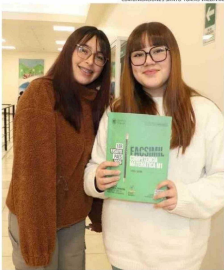
COMUNICACIONES SANTO TOMÁS VALDIVIA.