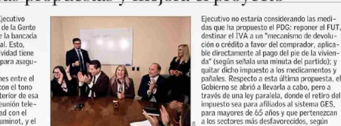
Ayer la bancada del PDG sostuvo una reunión para definir si apoyarán o no la idea de legislar.

Al interior de la colectividad señalan que las negociaciones lideradas por el ministro Quiroga se han llevado "muy mal", y aseguran que el secretario de Estado quiere ingresarlos sin modificaciones. En ese escenario, el