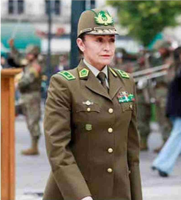
La jefa de zona analizó las estadísticas de accidentabilidad vial del año 2025 e hizo un fuerte llamado a la conciencia maulina para revertir la triste cifra de ser la región con mayor tasa de mortalidad por accidentes de tránsito en el país.