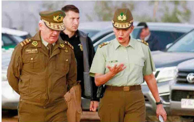
La máxima autoridad regional de Carabineros en terreno, como le gusta estar a diario en una región que le abrió las puertas y que señala se quedará a vivir.