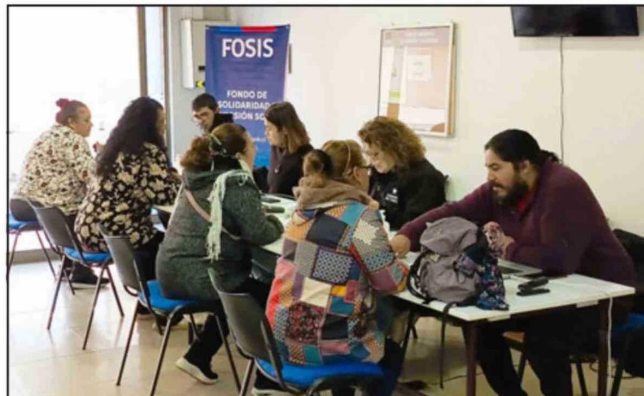
Fosis abre más de tres mil cupos para emprender en la Región de Valparaíso.