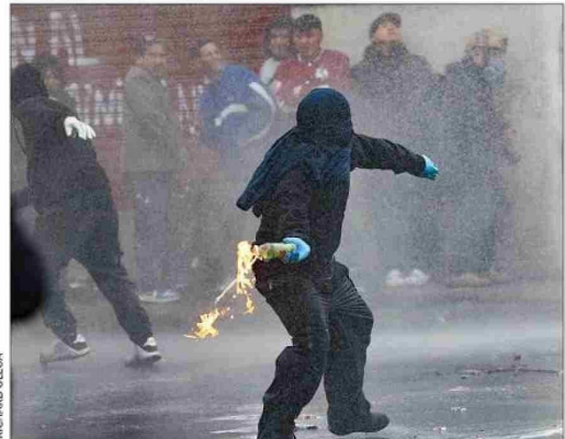
La marcha de la Central Clasista de Trabajadores y Trabajadoras, en cambio, estuvo marcada por los desmanes.

ponente, hasta llegar a Matucana. Un grupo de encapuchados generó una serie de incidentes, destrozando paraderos de buses, luminarias, cámaras de seguridad y señalética. La Prefectura Central de Carabineros también informó que sujetos arrojaron fuegos artificiales en las inmediaciones del metro Unión Latinoamericana. Efectivos de Control de Orden Público (COP) desplegaron un amplio contingente en el sector para hacer frente a los desmanes, utilizando gases lacrimógenos y apoyándose con