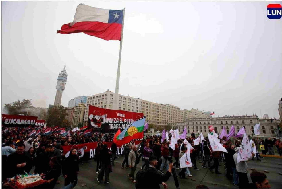
La marcha de la CUT partió a la altura de La Moneda y culminó en Portugal con Alameda.

También a las 10 horas, la Central Clasista de Trabajadoras y Trabajadoras convocó a una marcha que tuvo como punto de inicio la Alameda con calle Brasil y que transitó hacia el