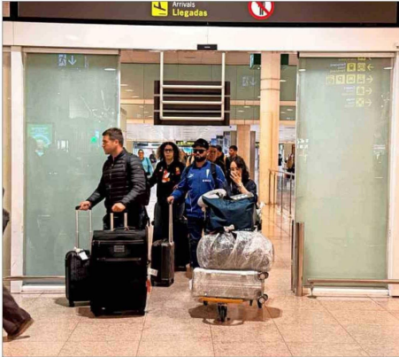
A las 8 de la mañana, hora local, llegó el expresidente Gabriel Boric a Barcelona, proveniente de Madrid.