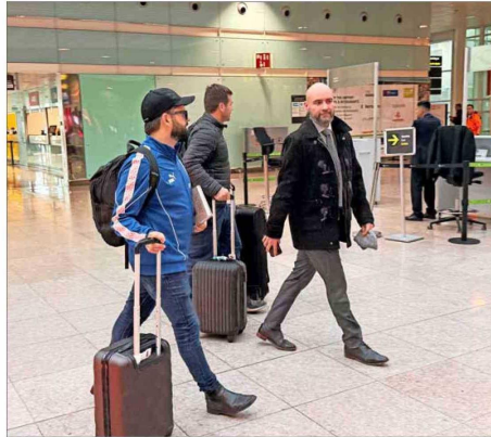
El exmandatario vestía botines, una chaqueta del club de la UC y un jockey. También llevaba el libro "La fábrica de papel".