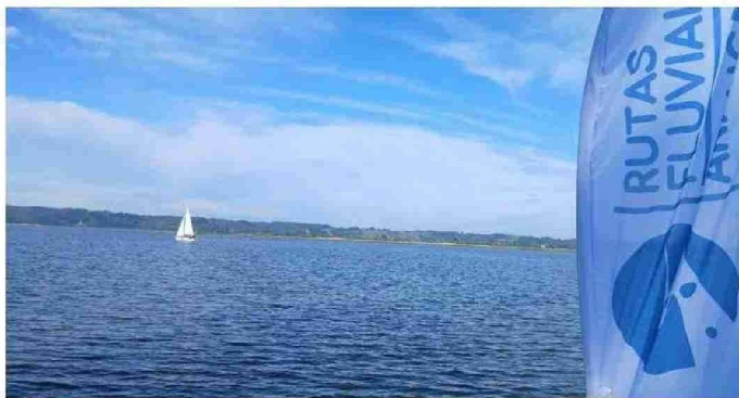
SERÁN TRES DÍAS DE NATURALEZA, RÍOS Y CULTURA.

10:30 horas hasta las 16 horas, reforzando el impulso al deporte náutico en la zona.