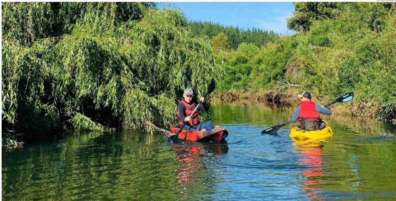
NATURALEZA, RÍOS Y CULTURA SE UNEN EN EL LANZAMIENTO OFICIAL DE LA TEMPORADA DE VERANO 2026 - RUTA CARAHUE NAVEGABLE.