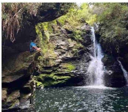
CARAHUE NAVEGABLE, INVITA A TODOS A SER PARTE DE ESTE GRAN INICIO DEL VERANO 2026.

El 17 de enero, la jornada se traslada a Nehuentúe, donde desde las 11 horas se dará inicio al Raid Fluvial por los ríos Moncul e Imperial, navegando hacia el Humedal Moncul y finalizando en la Costanera de Nehuentúe. Esta travesía permitirá apreciar la riqueza