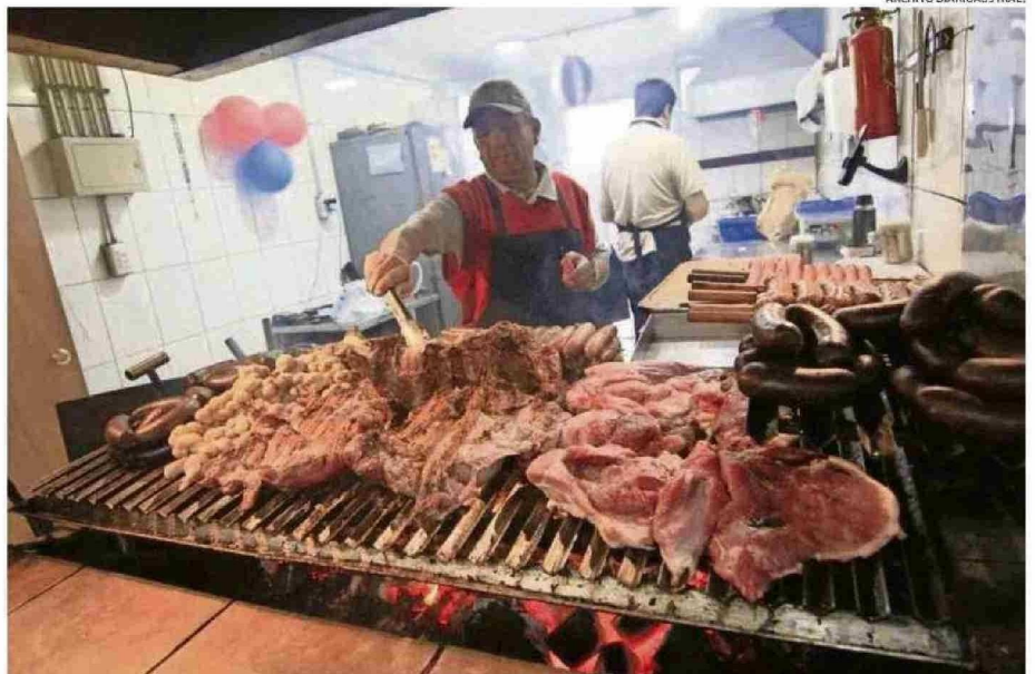
UN PANORAMA IMPERDIBLE PARA LOS TURISTAS RESULTA CADA AÑO ESTE CIRCUITO QUE REÚNE LO MEJOR DE LA GASTRONOMÍA Y TRADICIÓN LOCAL.