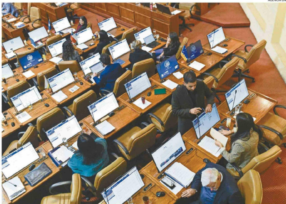
VA HAY DIPUTADOS QUE HAN DADO A CONOCER SU POSTURA RESPECTO A LA IDEA DE LEGISLAR. LA DC RECHAZARÁ.

El analista explicó que "por una parte, la lógica nacional y partidaria, donde los parlamentarios res-