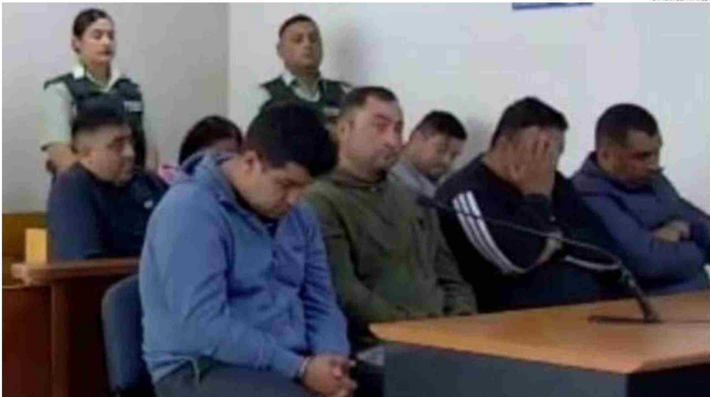
LA AUDIENCIA DE FORMALIZACIÓN EN LA SALA DOS DEL JUZGADO DE GARANTÍA DE PUERTO MONTT PARTIÓ CON UNA HORA Y 40 MINUTOS DE RETRASO. HOY SIGUE A LAS 11 HORAS.