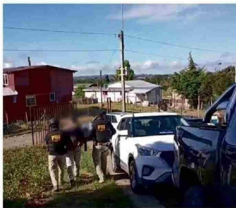
LA PDI REALIZÓ LAS DETENCIONES DE LOS GENDARMES ESTA SEMANA.

CONTINUIDAD DEL PROCESO Previamente, los defensores