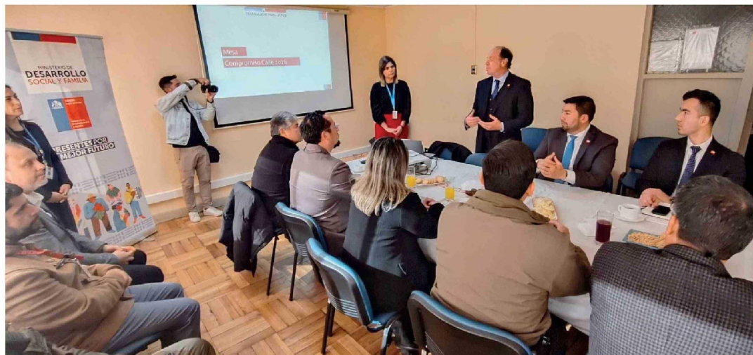
LA MESA "COMPROMISO CALLE" se desarrolló en dependencias de la Delegación presidencial provincial de Biobío.

"Estamos desarrollando una mesa Compromiso Calle que involucra a la región del Biobío completa, pero quisimos generar un hito importante en la comuna de Los Ángeles, donde