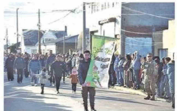
El Jardín Infantil Peter Pan fue una de las delegaciones educativas presentes en la ceremonia.

Zona Naval y una sección del Destacamento de Infantería de Marina N°4 "Cochrane".