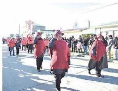
El Club Social y Deportivo "Rómulo Correa" desfiló junto a organizaciones vecinales durante la conmemoración de las Glorias Navales.