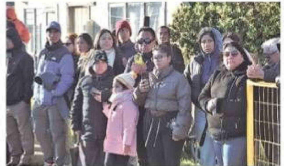
La comunidad del Barrio Prat participó masivamente de la ceremonia, pese a las bajas temperaturas registradas durante el mediodía sabatino.