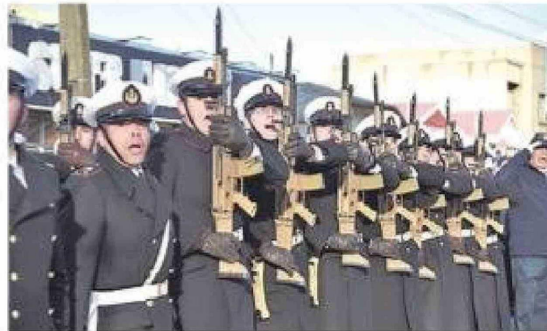
Representantes de la Tercera Zona Naval y de la Armada de Chile acompañaron el desfile.

La autoridad naval destacó además la participación de niños, colegios, centros de adultos mayores, agrupaciones folclóricas y Bomberos, además del despliegue de personal de la Capitanía de Puerto, la Gobernación Marítima, la Tercera