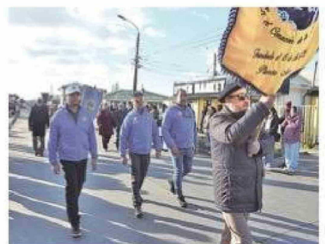
Con espíritu patriótico y participación estudiantil, la Escuela Arturo Prat Chacón se sumó a la conmemoración de las Glorias Navales.