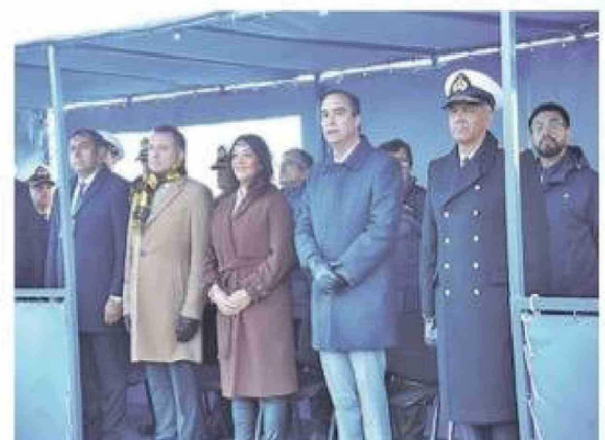
La delegada presidencial regional, Ericka Farias; el gobernador regional, Jorge Flies; y el alcalde de Punta Arenas, Claudio Radonich, encabezaron la ceremonia realizada en Plaza Esmeralda.

La descarga de las bases, para los interesados que las adquieran, se realizará a partir de las 18:30 horas del 29 de mayo de 2026.