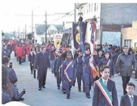
La comunidad educativa del Liceo Juan Bautista Contardi se sumó a la ceremonia desarrollada en Plaza Esmeralda.

versaciones para preparar la celebración de los 25 años del desfile en 2027. "Ya estamos pensando, junto a la Armada, en las Bodas de Plata de este desfile, que merece tener aún más fuerza por todo lo que representa para la comunidad", concluyó.