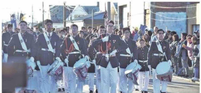
Alumnos de la Banda de Guerra del Instituto Don Bosco fueron parte de la vigésima cuarta versión del desfile ciudadano.

Entre los participantes destacaron delegaciones del Jardín Infantil Peter Pan, la Escuela Patagonia, el Instituto Don Bosco y el Liceo Juan Bautista Contardi. También estuvieron presentes la Séptima Compañía de Bomberos "Bomba Prat", el Círculo de Infantes de Marina en Retiro, la Unión Comunal de Adultos Mayores y