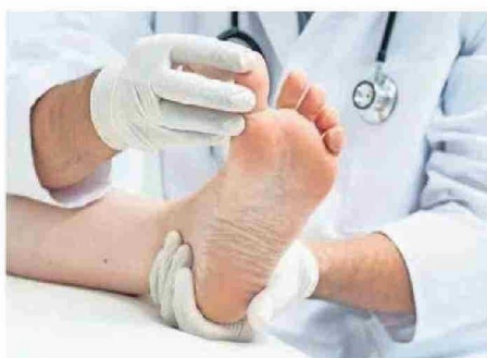
LOS PRIMEROS SIGNOS ES EL ENTUMECIMIENTO Y HORMIGUEO.

Uno de los primeros signos es el entumecimiento y hormigueo, que comienza en los pies o las manos y, con el tiempo, puede extenderse hacia las piernas y brazos. También es común sentir dolores punzantes o en forma de descarga eléctrica, sobre todo en las