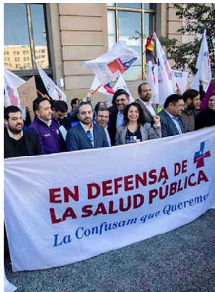
Confusam anunció estado de alerta nacional en atención primaria.

En ese contexto, Confusam anunció el inicio de un estado de alerta nacional en la atención primaria, además de la entrega formal de una carta de rechazo a las medidas adoptadas por el Gobierno.