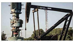
Las petroleras estadounidenses podrán explotar crudo en Venezuela.