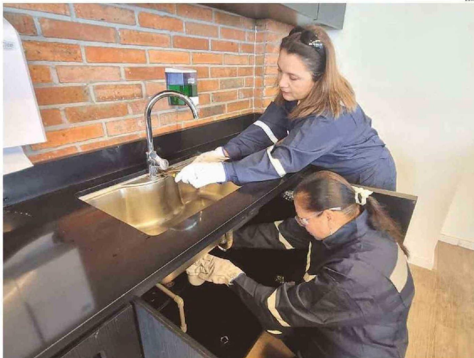
EL PROGRAMA CUENTA CON 44 CUPOS PARA MUJERES DE TODA LA REGIÓN

Se postuló el 8 de marzo. Ahora espera una edición de "Feminas que Inspiran".