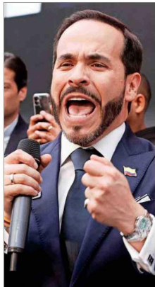
DE LA ESPRIELLA es el candidato más fuerte de la derecha en Colombia.

El Presidente que se elija en Perú el 2 de abril (con una posible segunda vuelta el 7 de junio) será el noveno mandatario en diez años. Con una enorme fragmentación partidaria, hay 37 candidatos para suceder al gobernante interino José Jerí, quien asumió