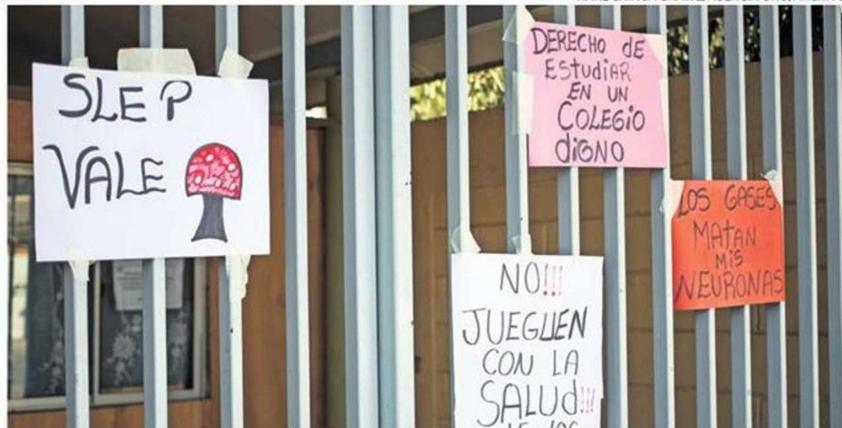
FRONTIS DE LA ESCUELA JESÚS FERNÁNDEZ HIDALGO CUANDO SE TOMARON EL ESTABLECIMIENTO.

En esta ocasión, el Centro General de Apoderados presentó un comunicado contando una actualización del caso, quienes señalaron que SLEP Atacama asumió su responsabilidad y realizó una serie de mejoras, comprometiéndose a terminar las reparaciones priorizadas el pasado miércoles y comenzar con los estudios para obras mayores a contar del pasado lunes y revisar avances de los mejora-