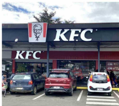
LA FRANQUICIA INTERNACIONAL KFC FUNCIONA EN EL STRIP CENTER.