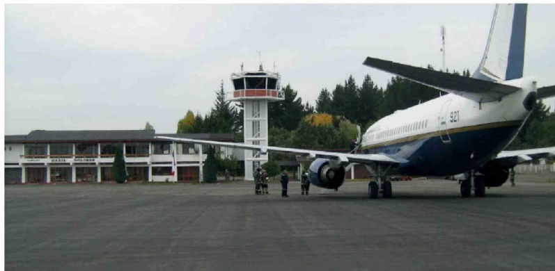
VISTA DEL AERÓDROMO María Dolores en Los Ángeles, infraestructura clave para la conectividad aérea de la provincia. Pese a sus condiciones operativas, el retorno de vuelos comerciales aún no tiene fecha definida.

Autoridades coinciden en que el aeródromo María Dolores cuenta con condiciones para operar, pero el retorno de vuelos dependerá del interés de las aerolíneas y nuevas inversiones. En paralelo, el alcalde advierte un crítico déficit hospitalario y llama a priorizar la construcción de nuevos recintos de salud en la provincia.