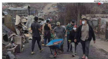
MÁS DE 42 MIL HECTÁREAS HAN SIDO AFECTADAS POR LOS INCENDIOS.

El aporte de Pulgar ha sido celebrado por hinchas y autoridades locales, quienes valoran su compromiso y solidaridad, destacando especial-