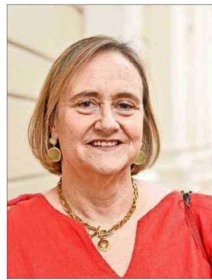
Leonor Etcheberry Court.