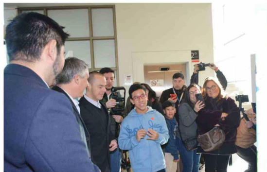
Niños, niñas y adolescentes de Teletón O'Higgins exhiben sus obras artísticas en una muestra abierta a toda la comunidad.

Cada obra expuesta refleja recuerdos, emociones y experiencias personales de sus creadores.