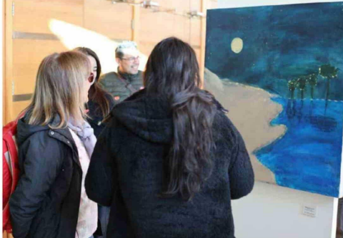
La exposición invita a descubrir historias de vida transformadas en arte y creatividad.

fortalecer su autoestima y participar activamente en la comunidad, a través de talleres donde combinamos creatividad con el proceso terapéutico", expresó.