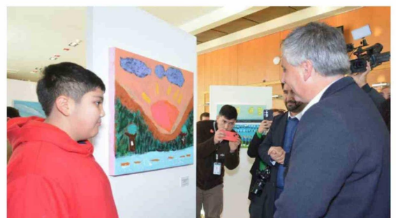
La comunidad podrá visitar gratuitamente la muestra hasta el próximo 4 de julio en el Teatro Regional.

Porque detrás de cada pintura hay mucho más que una técnica o una combinación de colores, hay historias de superación, emociones transformadas en arte y una comunidad que aprende a mirarse desde la empatía y la inclusión. 📷