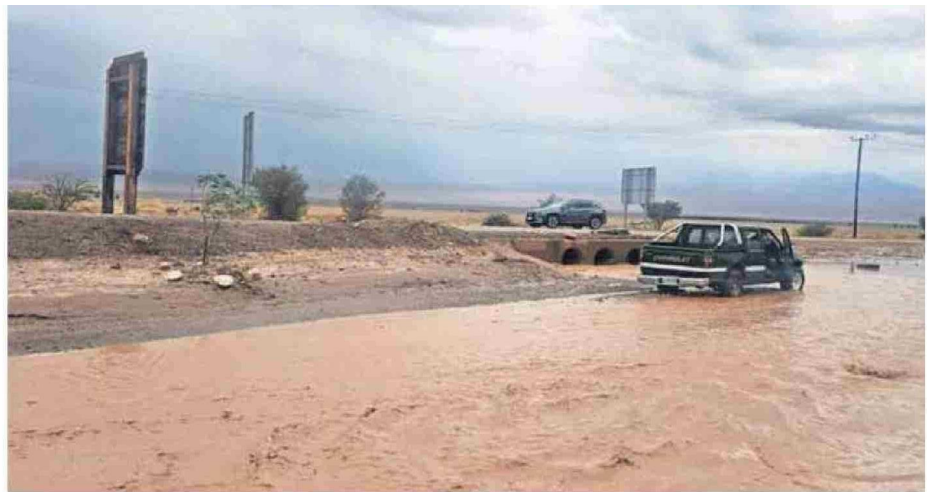
LAS LLUVIAS DEL FIN DE SEMANA PASADO AFECTARON A LAS COMUNAS DE LA PROVINCIA DE EL LOA COMO SAN PEDRO DE ATACAMA.

Respecto a la distribución de las precipitaciones, Díaz indicó que "las partes que más precipita van a ser las zonas cordilleranas de la región y el resto van a ser precipitaciones de tipo chubasco", detalló.