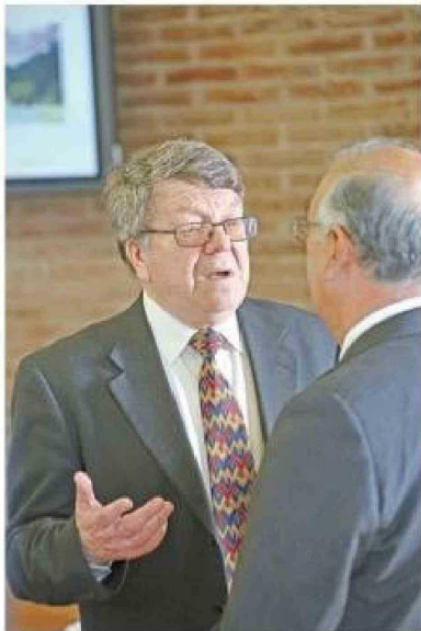
Alfredo Miranda como gobernador fueguino en noviembre de 2016.

Pero, esos tiempos de hitos, transformaciones e influencia del radicalismo parecen haber llegado a su fin. El 5 de febrero pasado, el consejo directivo del Servicio Electoral dispuso la disolución de 13 partidos políticos, entre ellos el histórico Partido Radical, tras concluir el proceso de calificación de la elección parlamentaria de 2025 por parte del Tribunal Calificador de Elecciones. La medida se adoptó en virtud de la Ley Orgánica Constitucional de los Partidos Políticos, que exige alcanzar un 5% de los sufragios válidamente emitidos en al menos ocho regiones o elegir un mínimo de cuatro