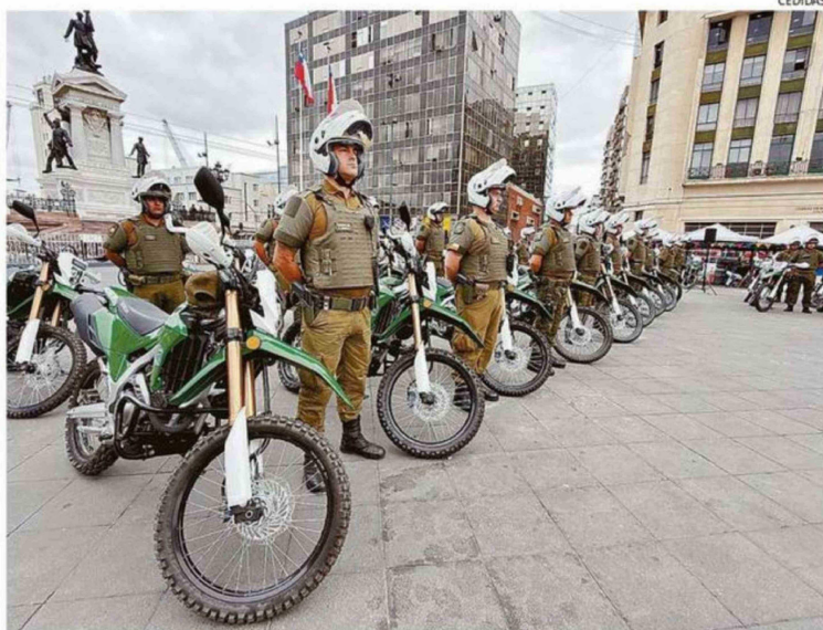
ENTREGA SE REALIZÓ LA JORNADA DE ESTE LUNES EN EL SECTOR DE PLAZA SOTOMAYOR, EN VALPARAÍSO.

“Todas las herramientas que nos entrega el Estado permiten ayudar a mejorar la sensación de seguridad y a mejorar nuestro proceder también y lógicamente que la disminución de delitos tiene mucho que ver con los elementos que se nos entregan. Asimismo, te-