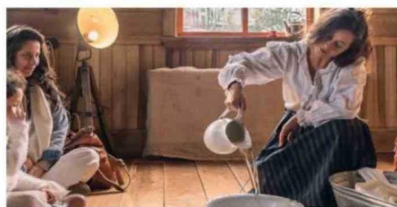
EN OCTAY HABRÁ EXPOSICIONES Y CHARLAS.

tico patrimonial, se realizó un esfuerzo conjunto con la mayor cantidad de actores posibles para que aparezcan en la programación de este fin de semana. Quien venga podrá visitar una exposición de pintura de alguna agrupación y otra agrupación, el día domingo, tendrá una charla sobre la vida y obra de Emilio Held. Ade-