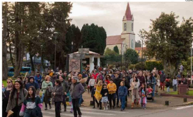
EL DÍA DEL PATRIMONIO MOVILIZA UNA GRAN CANTIDAD DE PERSONAS EN PUERTO OCTAY.

es el valor del copago para participar en la ruta patrimonial y gastronómica organizada por la Oficina del Adulto Mayor y Turismo de Purranque. El recorrido incluirá charlas.