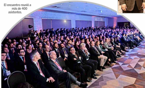
El encuentro reunió a más de 400 asistentes.