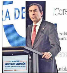
Ministro de Justicia y Derechos Humanos, Fernando Rabat.