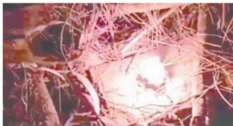
UNA DE LAS VELAS ENCONTRADAS EN EL LUGAR.

La técnica permite retardar la ignición y que los focos terminen uniéndose, dando origen a incendios de mayor magnitud, pero que afortunadamente, en este caso, "las velas fueron detectadas antes de que generaran nuevos focos,