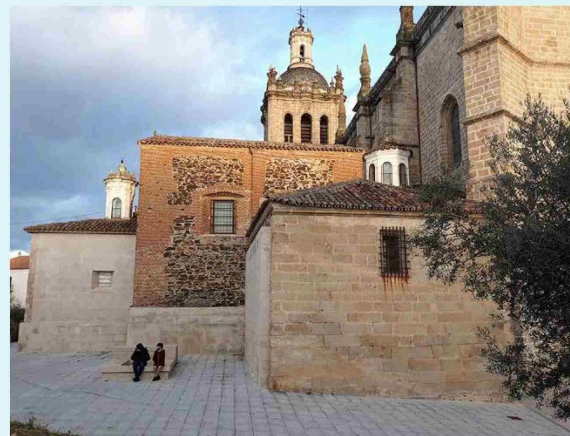
La Catedral de la ciudad de Coria (Cáceres, España), cuyas alas anexas al claustro se observan en la imagen, podría ser el primer templo cristiano de la Península Ibérica.

indicar que ambos fueron usados conjuntamente en la Última Cena ". "Esto podría deberse a que los judíos solían utilizar dos manteles en las grandes solemnidades, colocándose un primero para depositar