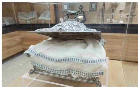
La pieza original del Mantel de la Última Cena, descrito por Antonio Puente en su libro 'España inédita', está guardado en una arca de plata en la Catedral de Coria (Cáceres, España).

ubicada en el convento de Santa Maria delle Grazie (Milán, Italia). La mirada del observador se centra naturalmente en los protagonistas de esta pintura de 8,80 metros de ancho por 4,60 metros de alto, pero en 'La última cena' aparecen numerosos elementos cargados de simbolismo (pan, vino, platos, cuchillos, vasos, un salero derramado y diversos alimentos adicionales). Todos estos elementos descansan sobre una