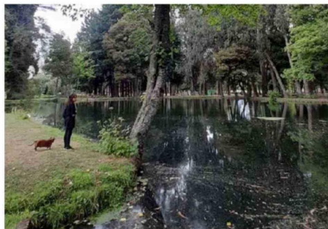
AL LUGAR LLEGAN VISITANTES DE TODA LA REGIÓN.

intervención integral de más de 27 hectáreas, orientada a mejorar la seguridad y los accesos, ordenar la planificación interna mediante zonas de uso definidas, recuperar y fortalecer áreas verdes con reforestación, además de crear y mejorar espacios de encuentro comunitario, juegos infantiles, equipamiento urbano, servicios higiénicos y zonas destinadas a actividades recreativas y culturales.