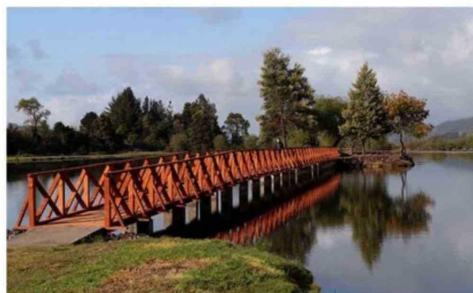
EL RECINTO CUENTA CON TRES IMPRESIONANTES LAGUNAS.