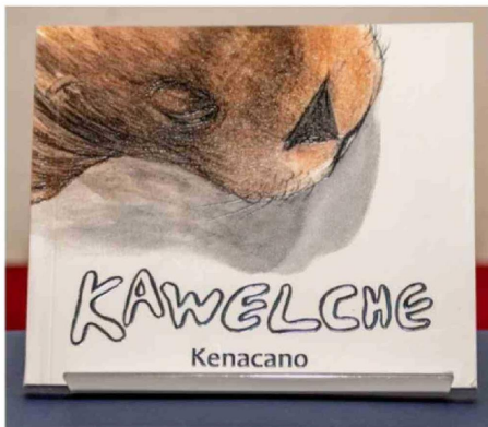
EL AUTOR DEFINE A “KAWELCHE” COMO UN LIBRO ÁLBUM.