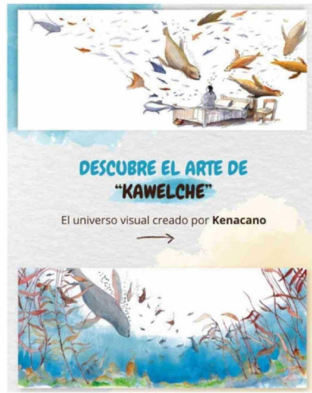
EL TÍTULO ESTÁ A LA VENTA EN LIBRERÍAS Y EN INTERNET.

“Ser jurado permite fijar la mirada en la creación que se gesta en territorios distantes a la Región Metropolitana. La importancia de que