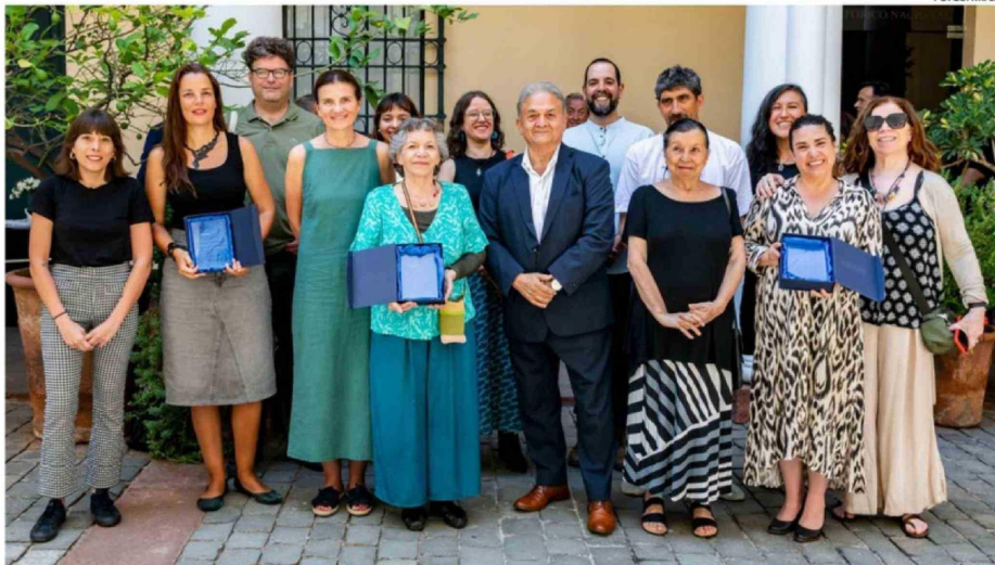
EN LA PREMIACIÓN NACIONAL FUERON DESTACADAS TRES OBRAS PUBLICADAS POR EDITORIALES CHILENAS EN EL 2025.

Dentro de esa misma línea, Kenacano profundizó en el contenido de la obra y su vínculo con la cosmovisión chilota. “Es un libro álbum, por lo tanto, la mayor parte son ilustraciones que cuenta con 70 páginas, con mucho color, que narra la historia de estas personas que cuando naufragan mueren en el mar o se convierten en otros seres, que es el Cahuelche y tiene que ver con la cosmovisión de Chi-